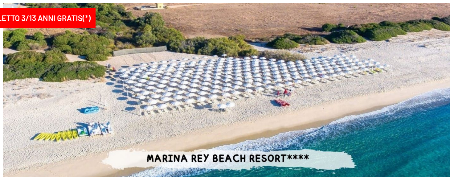
MARINA REY BEACH RESORT****

quote a persona in pensione completa bevande incluse ai pasti