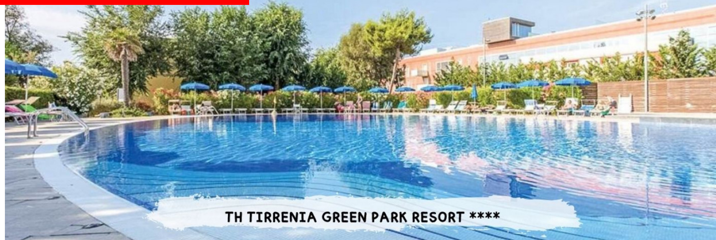
TH TIRRENIA GREEN PARK RESORT ****

PRENOTA PRIMA GARANTITO FINO AL 15 MARZO