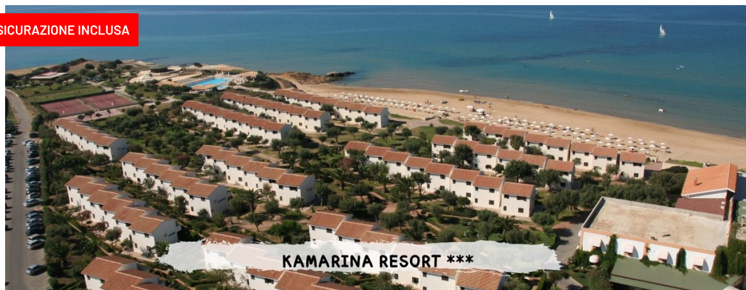
quote settimanali per appartamento - solo locazione