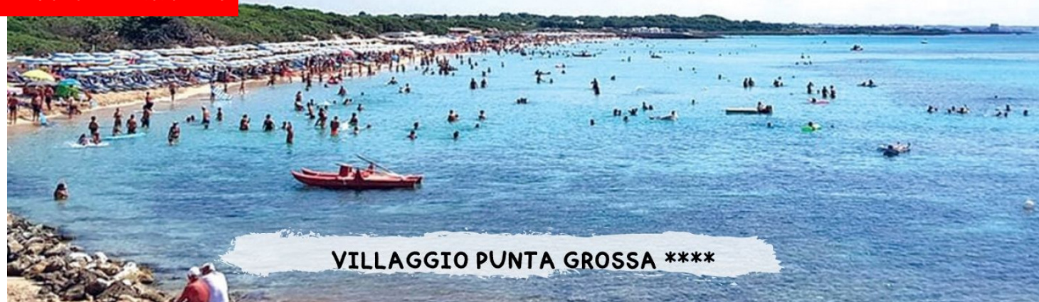
VILLAGGIO PUNTA GROSSA ****