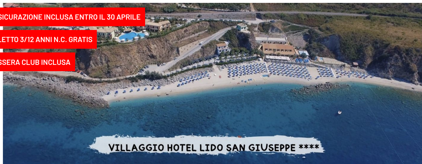
VILLAGGIO HOTEL LIDO SAN GIUSEPPE ****

quote a persona in pensione completa (*) bevande escluse