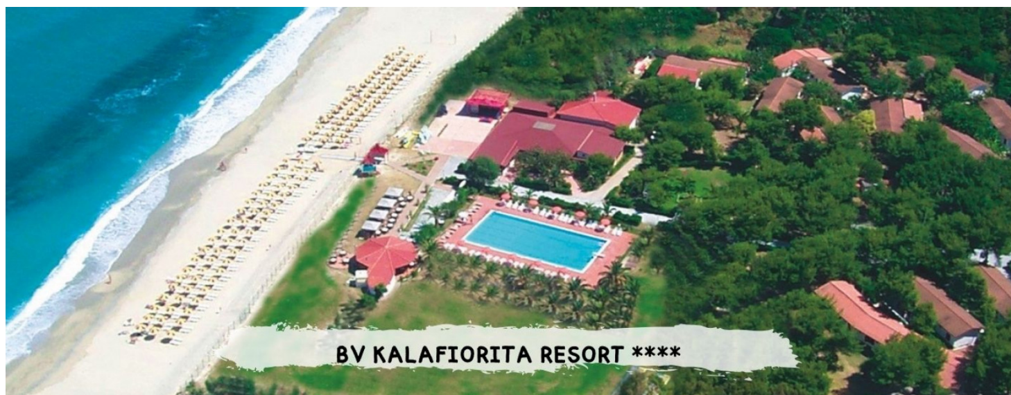
BV KALAFIORITA RESORT ****