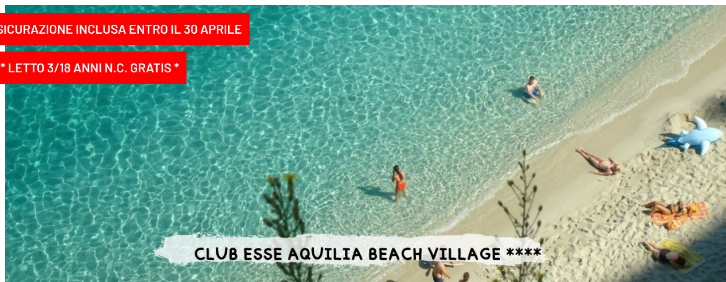
Quote a persona - all inclusive smile price (#)