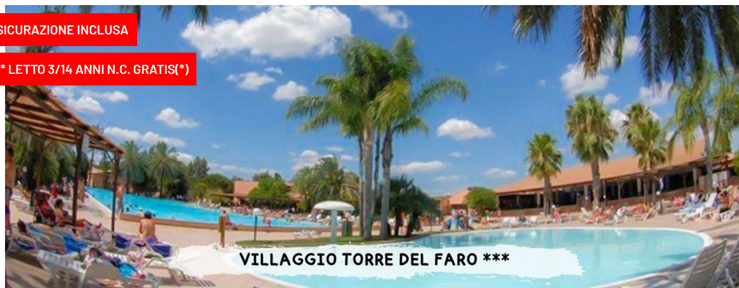
VILLAGGIO TORRE DEL FARO ***

quote a persona in pensione completa - bevande incluse in formula "mondotondo club"