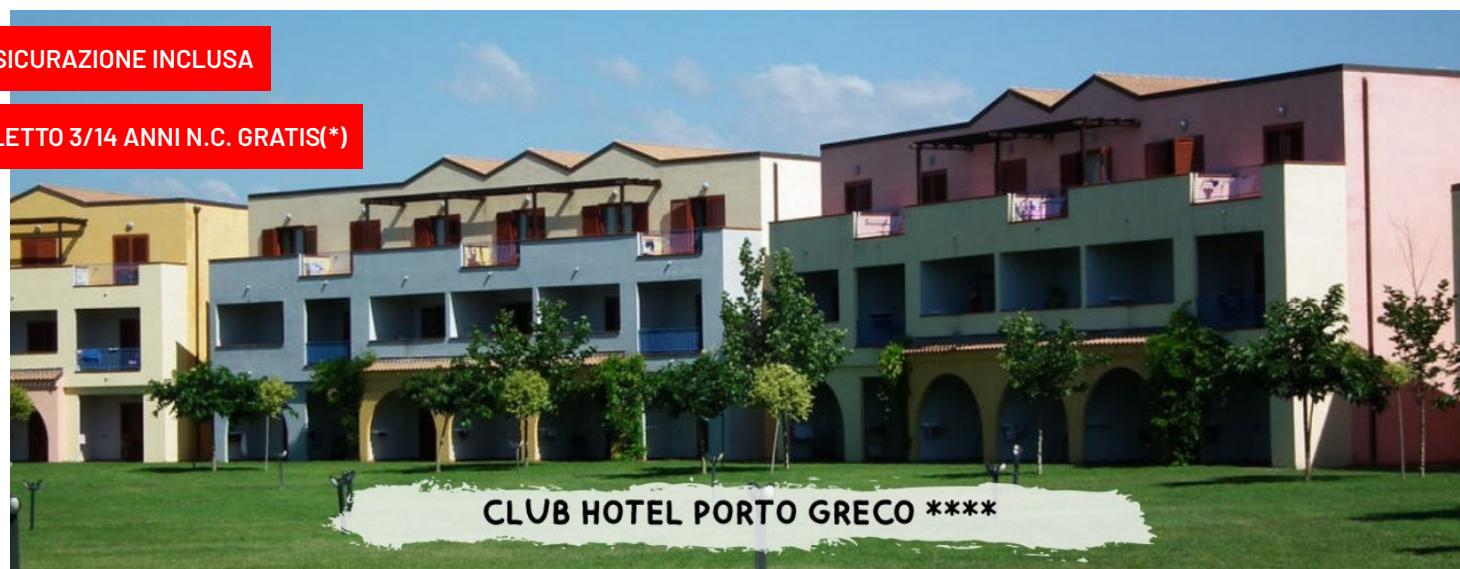
CLUB HOTEL PORTO GRECO ****

quote a persona in pensione completa – bevande incluse in formula "mondotondo club"