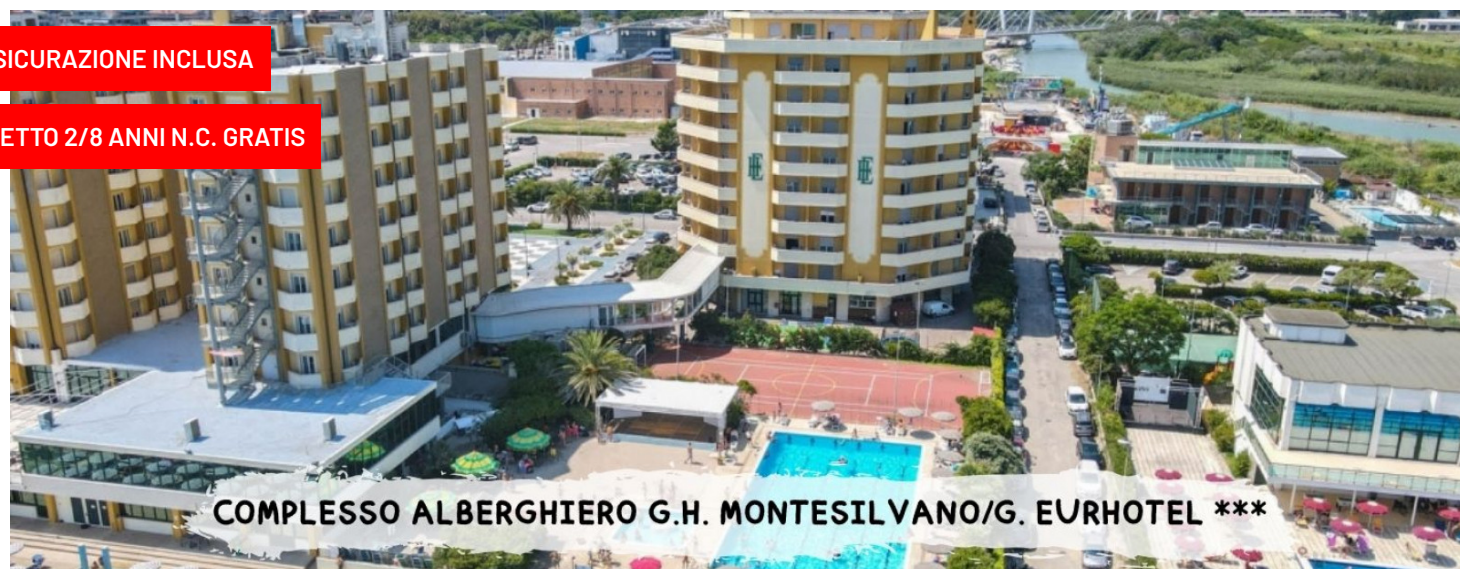
COMPLESSO ALBERGHIERO G.H. MONTESILVANO/G. EURHOTEL ***