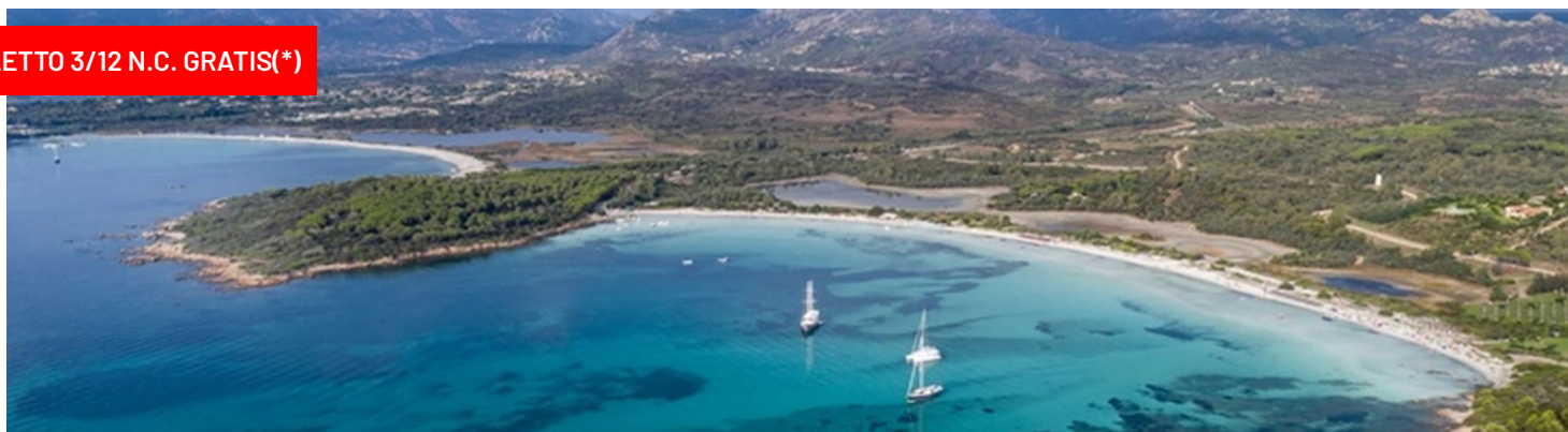
Quote settimanali per persona in camera Standard in Soft All Inclusive